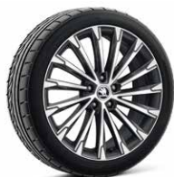
19吋 BECRUX 鋁圈