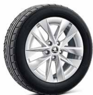
17吋 ROTARE AERO 鋁圈