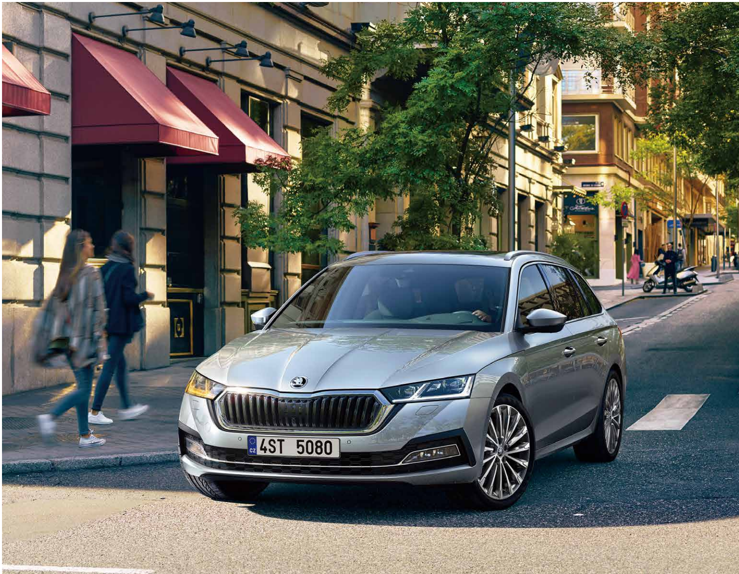
Škoda Octavia Combi 歐洲智世代旅行車。