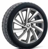
18吋 PERSEUS 鋁圈