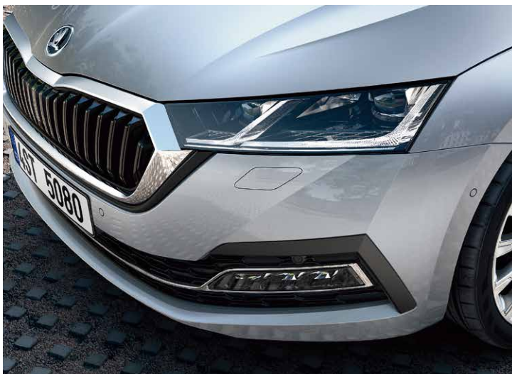
運用擋風玻璃攝影機，Octavia Combi 的 Matrix LED 智慧複眼頭燈組可以偵測前方或對向車輛自動調整遠光燈光束。提供最佳視線，又不會造成其他用路人目眩。