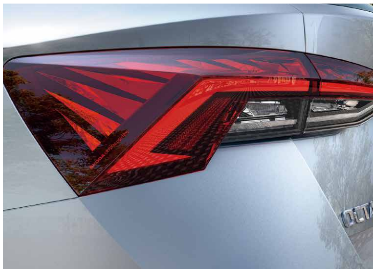
高亮度全 LED 尾燈組 (附動態轉向指示燈展演功能) 為車輛增添動態氣息。尾燈配備了 Škoda 家族代表性的裝飾元件。C 形照明運用現代化手法再次升級，水晶元素則代表了捷克水晶玻璃的製造傳統。