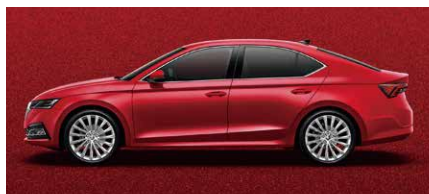
炫彩紅 K1K1 (須加價選購)