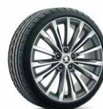
19 吋 TRINITY 鋁圈