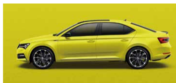
帝王金 9195 (須加價選購)