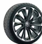
19 吋 SUPERNOVA 鋁圈