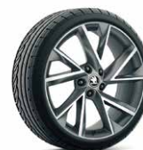
19 吋 VEGA 鋁圈