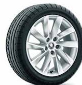
17 吋 STRATOS 鋁圈