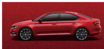
炫彩紅 K1K1 (須加價選購)