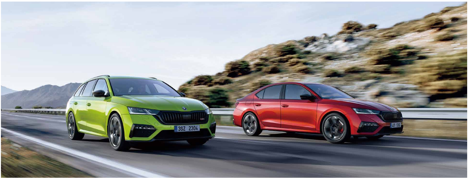
OCTAVIA RS 車系搭載 245 匹馬力的 2.0 TSI 渦輪增壓引擎，0-100 公里加速只需要 6.7 秒。