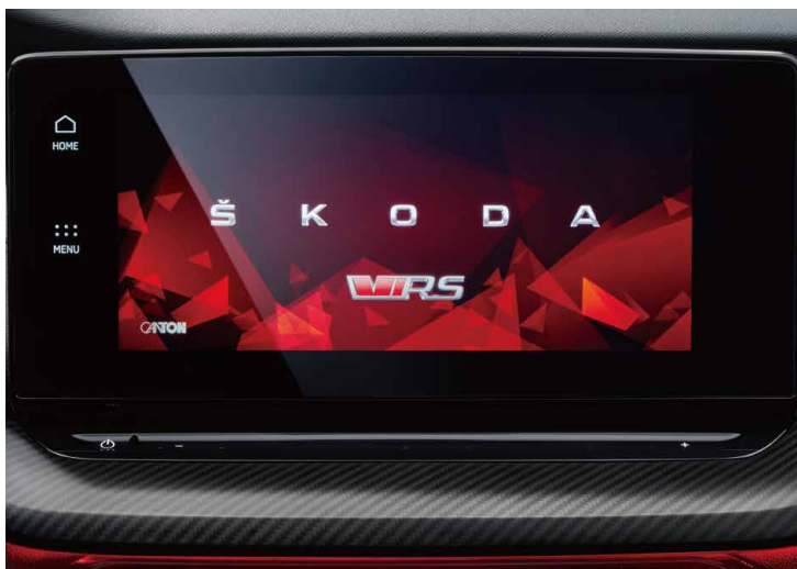
OCTAVIA RS 車系專屬歡迎 LOGO 和動畫。