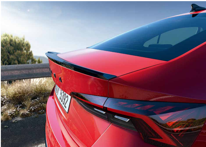
OCTAVIA RS 專屬黑色跑車尾翼增添動感氣息。