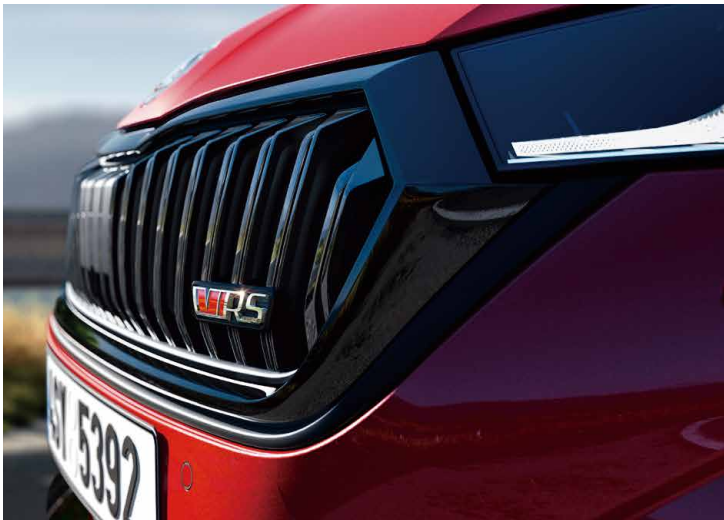
性能代表的 RS 徽章象徵獨特與不凡，淬鍊自 SKODA 賽車事業的造車精髓。