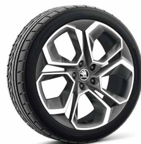
19 吋 Altair 鋁圈