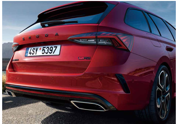
OCTAVIA RS 車系搭配雙邊不鏽鋼排氣尾管，此外 Matrix LED 智慧複眼頭燈、動態序列方向尾燈皆列為標配。