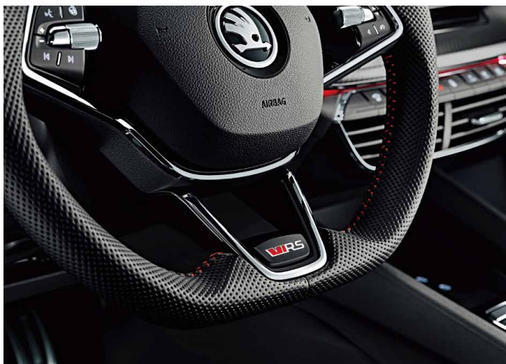
方向盤上的 RS 標誌，一上座即開始享受駕馭樂趣