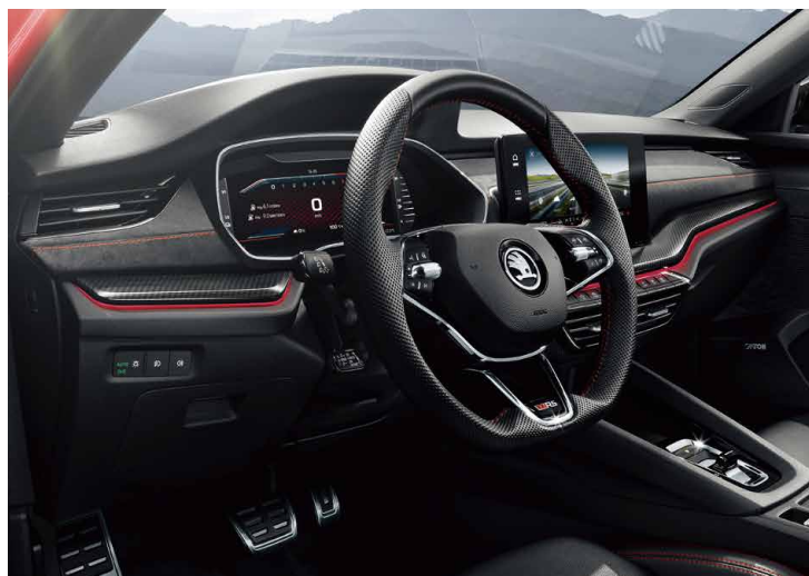
三幅跑車式平把真皮多功能方向盤(附換檔撥片)、10.25 吋全螢幕全彩數位儀、RS 專屬金屬踏板表皆列為標配。