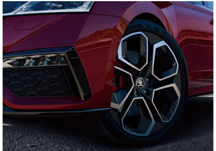
OCTAVIA RS 車系標配 19 吋 ALTAIR 鋁圈，運動感十足。