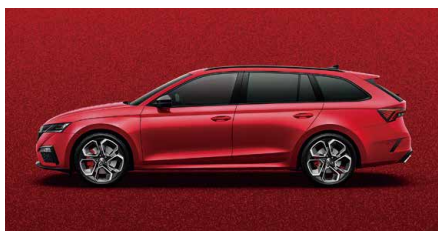
炫彩紅 K1K1 (須加價選購)