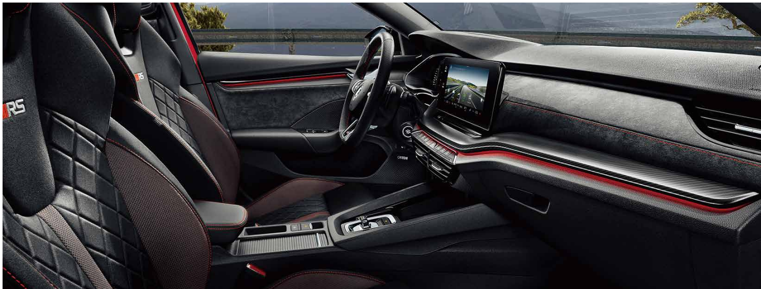
OCTAVIA RS 車系專屬運動座椅包覆性十足，椅背的 RS 專屬字樣瞬間引燃戰鬥氣息，專屬 RS 方向盤運用打孔皮革並搭配紅色縫線。