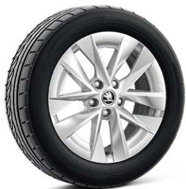
1.5 TSI/ 115hp (選配) 17吋Rotare空氣銀鋁合金輪圈