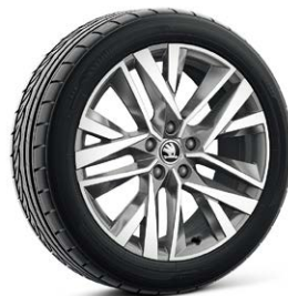
1.5 TSI/ 150hp 18吋Lerna金屬灰髮絲紋鋁合金輪圈