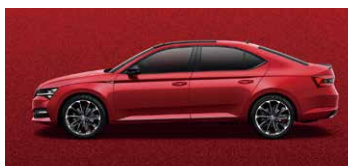
炫彩紅 K1K1 (須加價選購)