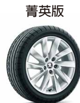
17 吋 STRATOS 鋁圈