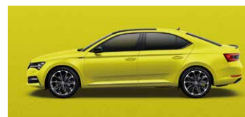
帝王金 9195 (須加價選購)