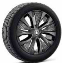
18吋 PROCYON 黑化 AERO 鋁圈