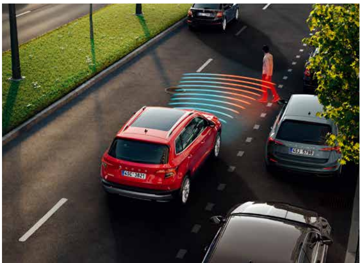
Front Assist 前方輔助系統設於前方的雷達偵測能與前車保持安全距離，並進一步融合、緊急煞車功能，一旦偵測危險，立刻透過聲音、燈示、細微煞車震動警示駕駛者。