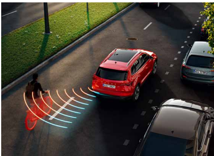
Side Assist 車側盲點警示系統運用雷達科技監控車輛兩側及後方區域，使變換車道更安全，可監控最多 70 公尺的區域。