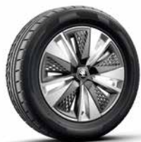
17吋 SCUTUS AERO 鋁圈