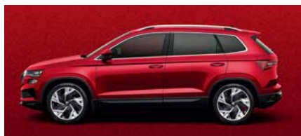
炫彩紅 K1K1 (須加價選購)