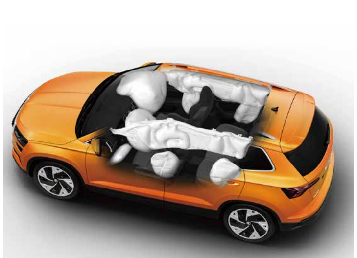
Karoq 標配 9 氣囊，用全方位審慎態度增進行車安全。