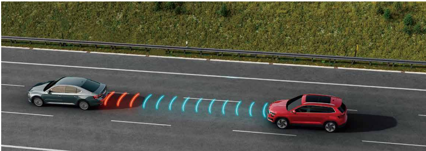
Travel Assist 智慧車陣輔助系統讓安全防護更上層樓。Karoq 採用電容式方向盤能持續感應駕駛者狀態，這項功能結合虛擬數位駕駛艙，時時刻刻提供最佳安全防護。