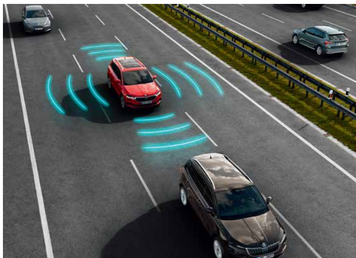
Emergency Assist 緊急待援輔助系統能在駕駛人突然身體不適等情況時，藉由安全停下車輛並亮起警示燈來降低發生意外事故的風險。