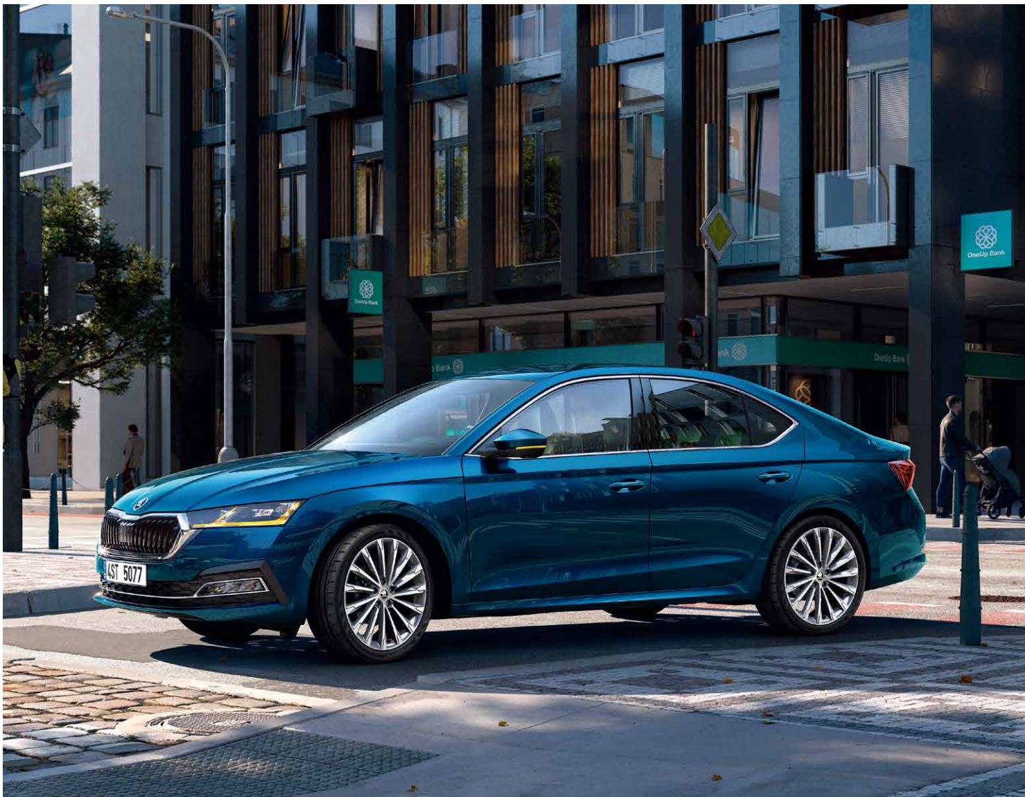
Škoda Octavia 歐洲智世代旅行車。